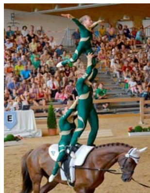
Dt. Vizejugendmeister Voltigieren: Juniorteam Schenkenberg I